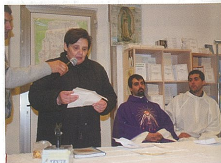
Una testimonianza di guarigione

Se noi siamo dei figli ribelli, Dio non può prendersi cura di noi. Lasciamo invece che Lui si prenda cura di noi. Dobbiamo essere dei bambini davanti a Dio ma giganti nella testimonianza nel mondo. Sia lodato Gesù Cristo!