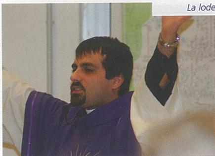
La lode al Signore