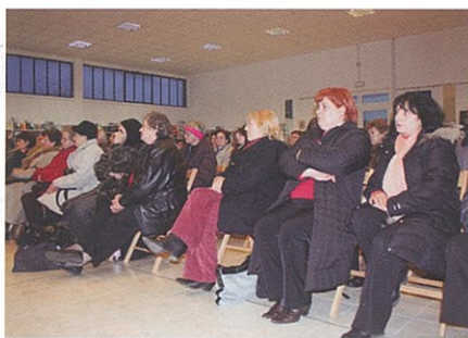
La sala gremita di fedeli

Il Vangelo ci dice chiaramente che la venuta di Gesù è per sconfiggere il potere del diavolo. Partiamo dal presuppo-