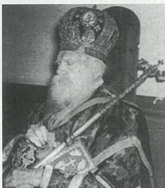
S. B. Metropolita Crisostomo di Florina 1° Primate della Chiesa greca Paleioimerologhita morto nel 1955 in odore di santità