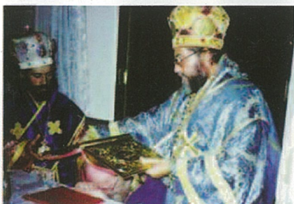
Sua Beatitudine EVLOGHIOS I Metropolita Ortodosso di Milano e Aquileia della Chiesa Ortodossa di Milano, consacrato vescovo nel 1984 per volontà del Primate della Chiesa Ortodossa Greca vecchio calendarista, S.B. AVXENTIOS di Athene.