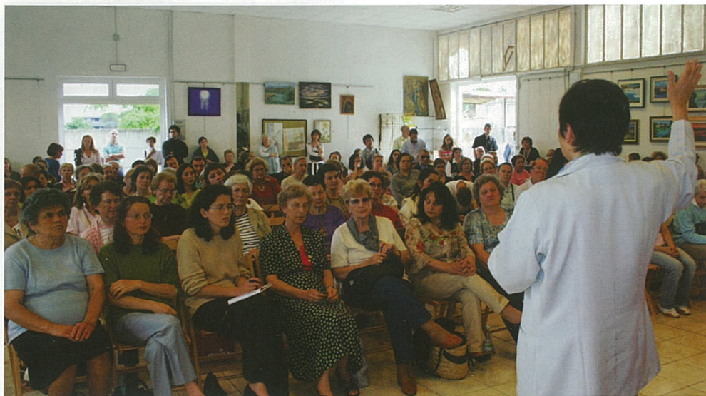
Un pubblico numeroso ha ascoltato la testimonianza, con profonda partecipazione e momenti di intensa commozione.