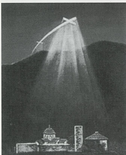
Miracolo dell'apparizione della Santa e Vivificante Croce, segno benedicente per la chiesa ortodossa

Il documento che certifica l'avvenuta consecrazione. La pubblichiamo visto che le male lingue hanno già messo in dubbio cose e fatti di cui sono stati smentiti