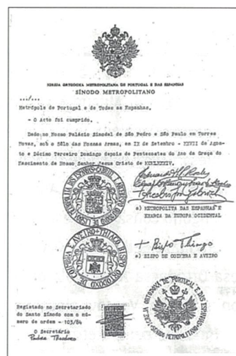
Bolla di consacrazione del Metropolita Evloghios che, nel 1990, dopo la partenza del Metropolita Gabriele, fu eletto secondo primate della nostra Metropolia.